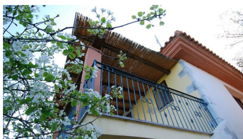
Particolare della veranda